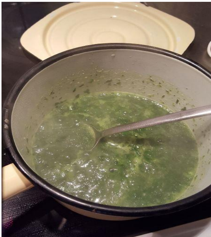
Smaka av med vitpeppar..soppan blev riktigt lyckad...