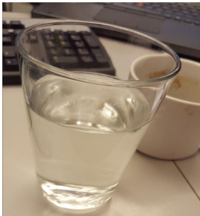
Ta gärna kanel på(räknas som 0 kalorier)...riktigt gott med päron, fil och kanel :)