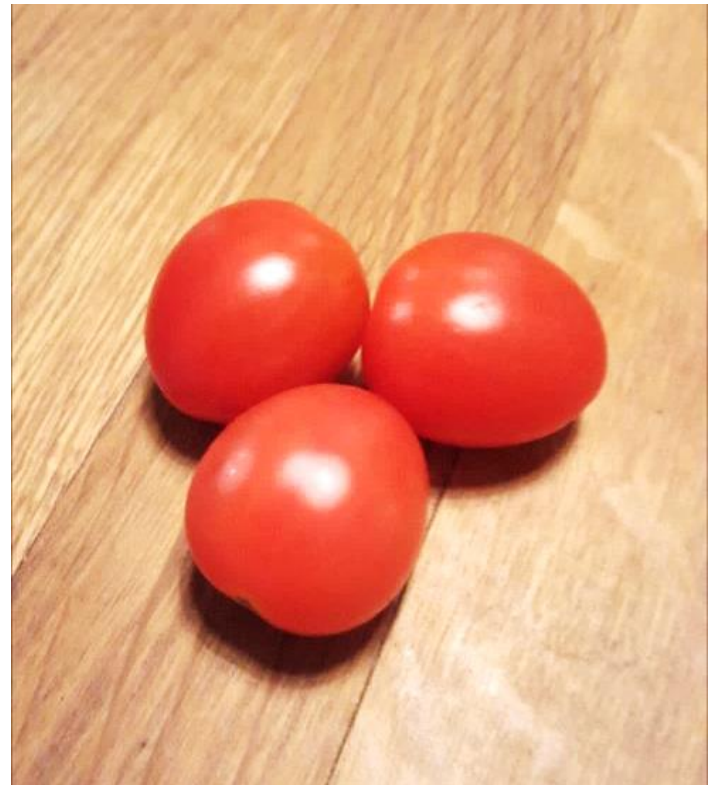
Lite bilder från matlagningen...