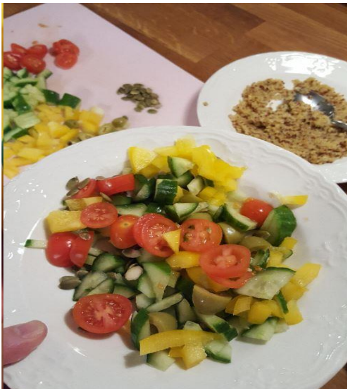
Så här såg det ut när jag var klar, en matlåda till mig och en tallrik till Sofia...