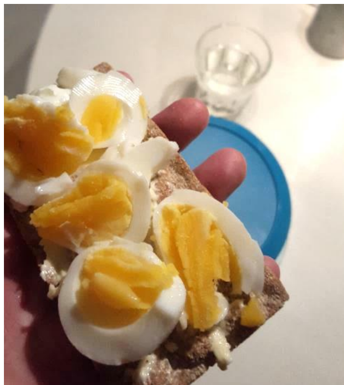
Idag har dagen gått fort, på jobbet gjorde kaffe och vatten susen..