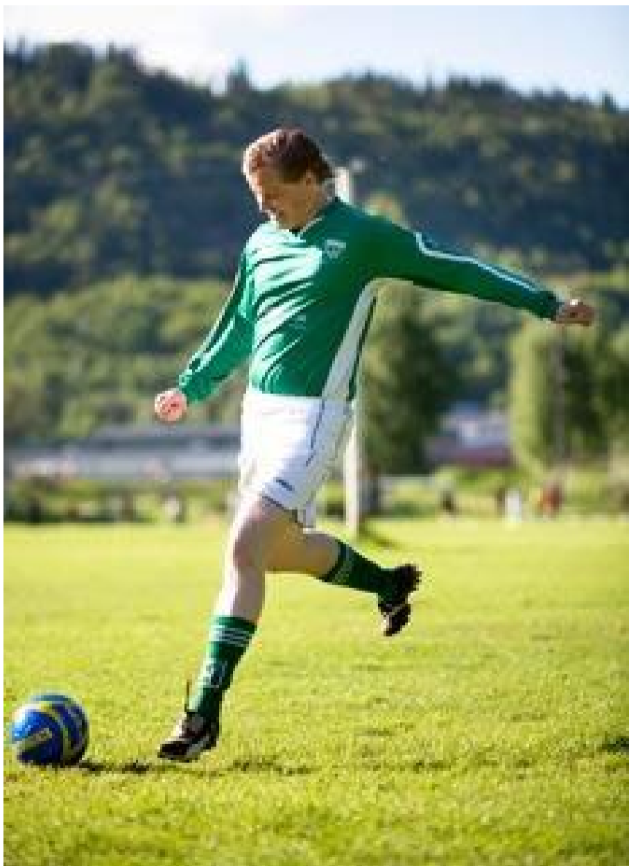
Michael Mosley och 5:2-dieten kan jag tacka för mycket!

Nämner redan nu att jag har skapat ett forum där du rätt snabbt får ett svar av mig, eller någon annan, om du undrar över något.